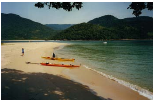
Ilha de prumirim