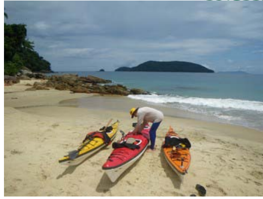
Praia do Cedro