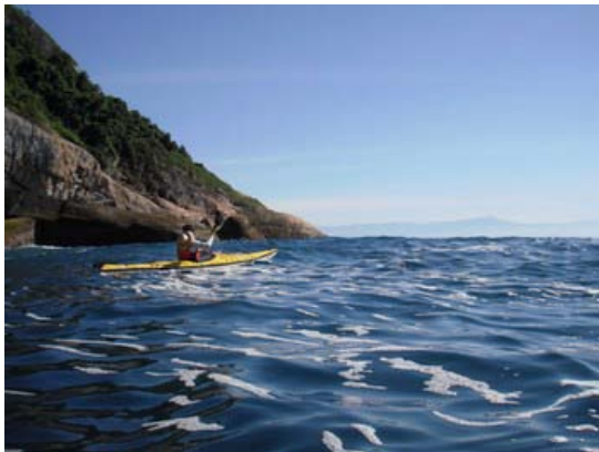
Ponta da Juatinga

Apesar da proximidade das maiores cidades do Brasil, a Expedição Paraty – Ilhabela passa por regiões ainda desabitadas e sem acesso, cheias de praias desertas, baías recortadas e mar aberto. Uma expedição de aproximadamente 180 km, que vai botar à prova as suas habilidades canoísticas e com certeza não vai sair da sua memória tão cedo! Com remadas longas e desafiadoras, mas também com tempo para desfrutar esse lugar único.